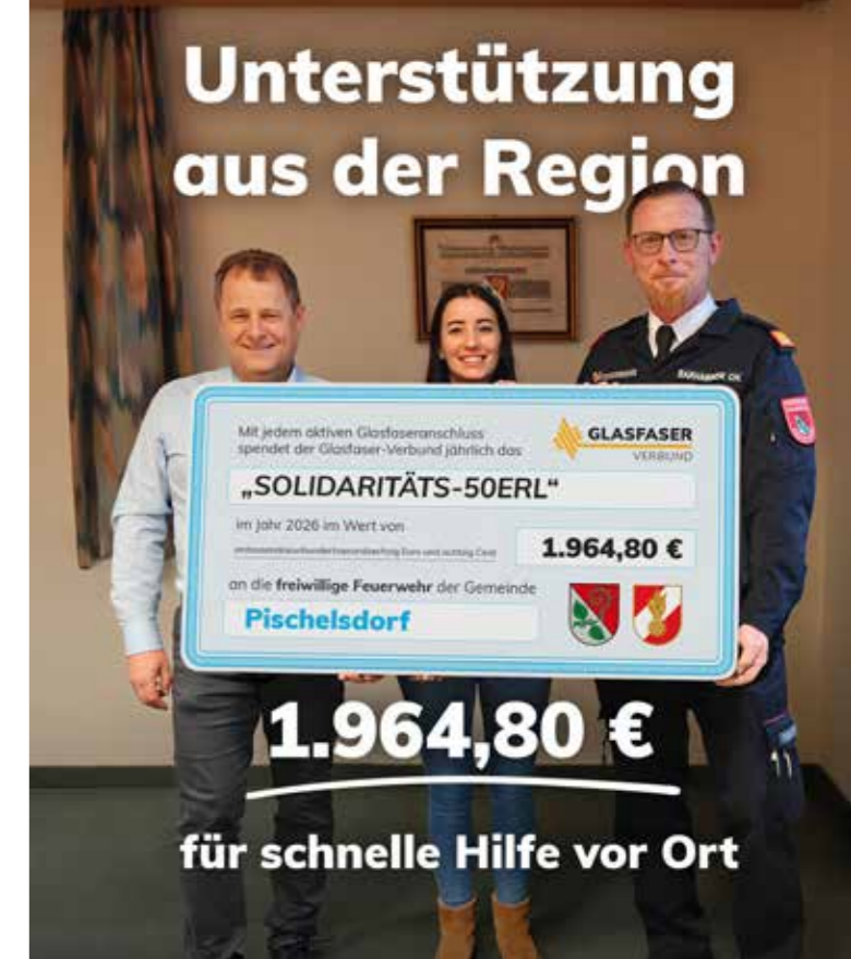
Überreichung des „Solidaritäts 50erl“ an die Feuerwehren der Gemeinde Pischelsdorf durch den Glasfaser-Verbund.

Glasfaser verbindet nicht nur Häuser, sondern auch Menschen und Engagement in unserer Region.