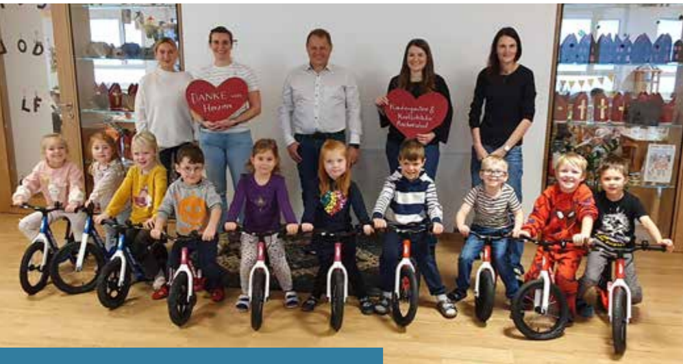
Ein großes Dankeschön an die Firma KTM-Fahrrad GmbH.

Über eine besonders großzügige Spende durften wir uns kürzlich sehr freuen: